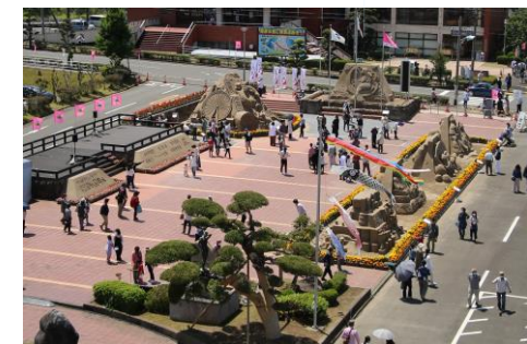
2021年(令和3年) 第34回吹上浜砂の祭典 新型コロナウイルス感染症に対応したイベントとして「まちなか」での開催