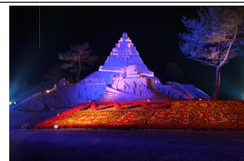
2011年(平成23年) 第24回吹上浜砂の祭典 会場を砂丘の杜きんぼうに移転し、2回目となる「砂の彫刻世界選手権大会」を開催